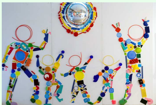
Progetto di arte ed espressività “PROGETTO ARTE”

Destinatari: tutti gli alunni SEZ. A 5 ANNI