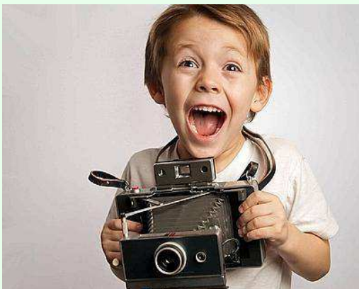
Progetto di arte ed espressività "IL NOSTRO MONDO IN UN CLICK"

Destinatari: gli alunni DI 5 ANNI dellasezione A Conduttori: docentedi classe. Tempi: novembre-aprile Finalità: proporre un percorso di osservazione ed espressione attraverso il linguaggio creativo dell'arte fotografica.