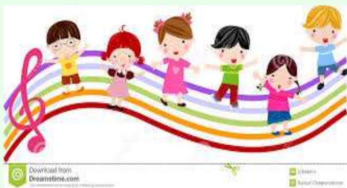
Progetto di educazione musicale "MA CHE MU...SICA MAESTRA"

La Scuola dell'Infanzia propone ogni anno diversi progetti-laboratorio che, utilizzando tecniche di didattica laboratoriale, accompagnano i piccoli alunni nel percorso di scoperta dei Campi di esperienza e contemporaneamente arricchiscono il curricolo. Essi sono condotti dalle docenti di classe in orario curricolare, senza oneri. Solo per due di essi le docenti saranno coadiuvate da esperti esterni.