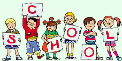
Progetto di potenziamento lingua inglese e certificazione competenze con esame in sede "TRINITY"

Attività: di pratica strumentale nei locali della scuola Scherillo; facile teoria della musica e pratica degli strumenti musicali con uso della dotazione scolastica partecipazione a manifestazioni di fine anno presso la scuole ad altre manifestazioni sul territorio