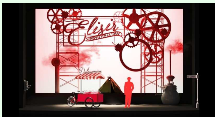
Progetto di educazione musicale ed avvicinamento all'Opera Lirica "OPERADOMANI"

con la collaborazione di esperti esterni di Associazioni, Istituzioni, Enti, a titolo gratuito ovvero con il supporto organizzativo e di coordinamento di Inss. con competenze specifiche ovvero con l'integrazione di brevi esperienze laboratoriali o spettacoli teatrali condotti dagli esperti delle Assoc.