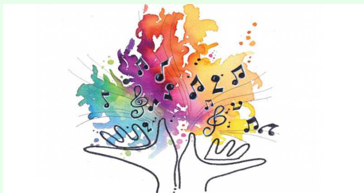
Progetto di educazione musicale e pratica strumentale "DO, RE, MI...PIACE"

Progetti svolti in orario extracurricolare dagli alunni e condotti da docenti in orario extracurricolare o da esperti esterni competenti retribuiti. Questi progetti, al momento della pubblicazione del PTOF sono in via di approvazione e di realizzazione per i tempi tecnici dello studio di fattibilità, reperimento fondi, bandi per il reclutamento di esperti esterni e tutor.