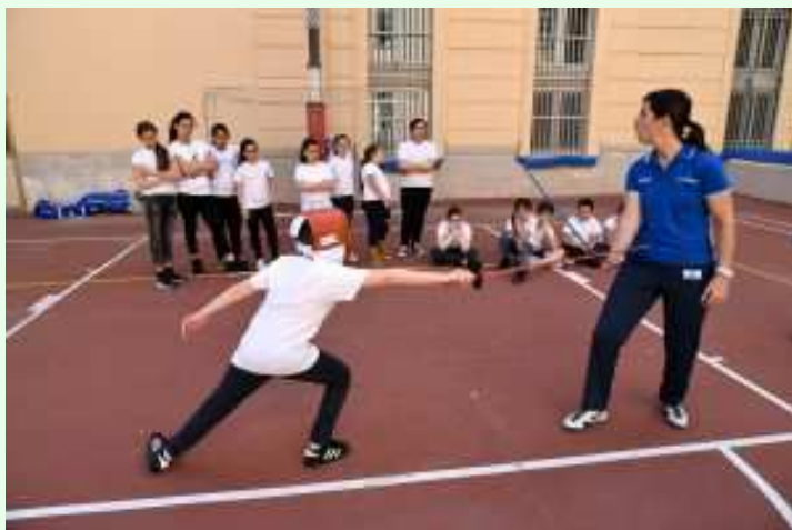
Progetto di educazione fisica e sport "FENCING FOR CHANGE"

Attività: Lezioni nella palestra della scuola con esperto esterno