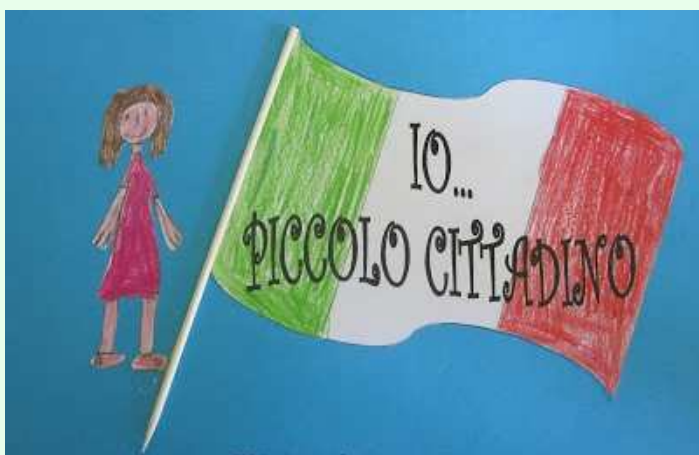
Progetto di cittadinanza attiva "IO, CITTADINO DEL MONDO"

Destinatari: tutti gli alunni delle della scuola dell'infanzia e della primaria