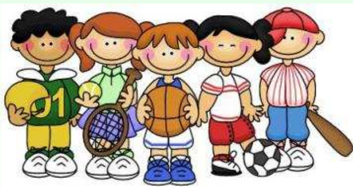
Progetto di educazione motoria "PROGETTO EUROPA"

Finalità: promuovere la conoscenza e l'amore per l'espressione musicale; proporre una prima alfabetizzazione musicale degli alunni attraverso l'ascolto di semplici ritmi e canzoncine da memorizzare.