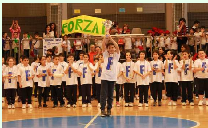
Progetto di educazione motoria e sport "QUARTIADI"

Destinatari: tutti gli alunni delle cl. quarte