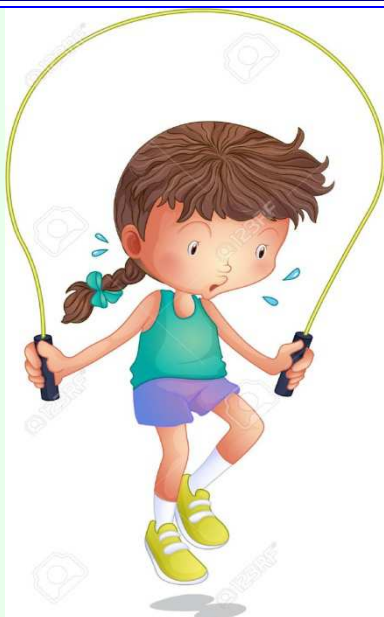
Progetto di educazione fisica e sport "PROGETTO EUROPA"

Destinatari: tutti gli alunni delle classi prime seconde (tranne sez E)terze quarte quinte